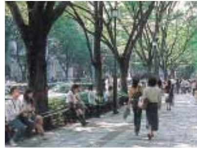
ベンチ代わりの“プラスバンド”

当会が一番力を入れているのは“美しい環境を維持すること”である。その代表が掃除隊で、月曜日から土曜日までは、有志が持ち回りで表参道、明治通りの定期清掃を行っている。オシャレなユニフォーム姿で街を清掃する光景を目の前で見させていただくことによって、ゴミを捨てないマナーの啓蒙になることも期待している。特に、イベントの後などは掃除隊がデモ行進のよ