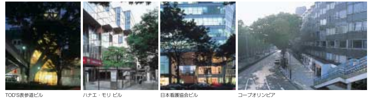
TOD'S表参道ビル ハナエ・モリビル 日本看護協会ビル コープオリンピア

「ハナエ・モリビル」（1978年）の出現も特記できよう。丹下健三の設計によるこのビルは、表通りから少し奥まった位置にミラーガラスの外壁を構え、小ぶりながらも、そのままマンハッタンに配しても通用する水準のモダニズムの空間を出現させた。ファッション領域を超えて日本社会の女性のリーダー役の森英恵がここに拠点を構えたのは、ファッションストリートとしての街の位置取りと性格を決定づける出来事だったといえよう。