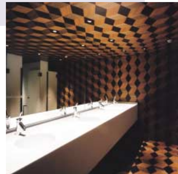
7階トイレ 洗面コーナー（テラスとも写真：横瀬博一）