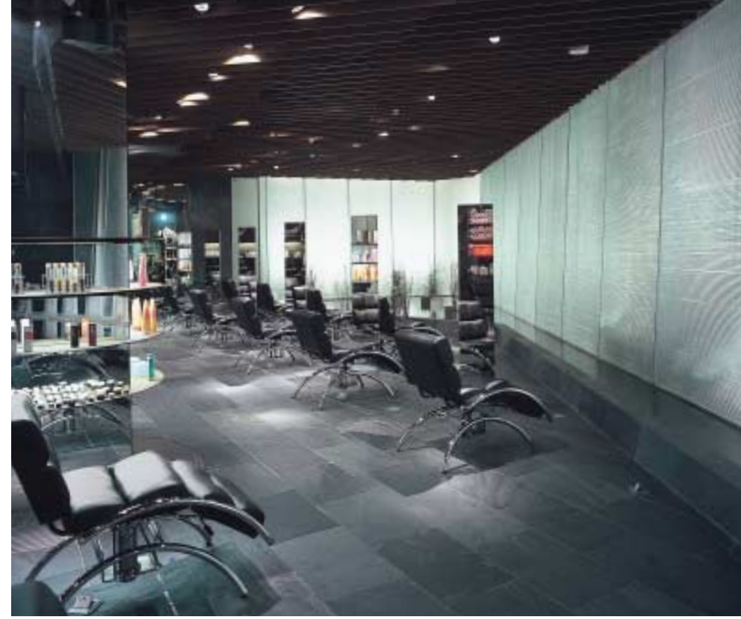
暮らしをデザインする

すずき・えどわーど——建築家・鈴木エドワード建築設計事務所／1947年生まれ。1975年、ハーバード大学大学院アーバンデザイン建築学修士修了。1977年、鈴木エドワード建築設計事務所設立。主な作品：東京倶楽部（1992）、ムバタ・ロッジ（1992）、さいたま新都心駅および東西自由通路（2000）など。