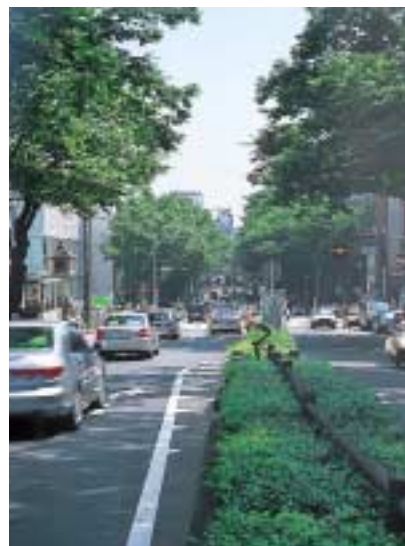
表参道 青山方面を見る

環境、景観、そして何よりも“明治神宮”の存在によるだろう。つまり、表参道は日本的なものと極めてモダンなものが密接に絡み合っていて融合し、独特の雰囲気を出している。表参道の価値はそこにある。そのような他にはない街の魅力・個性を守っていかなければならない。「櫛会」では、長い間、地道に活動を続けてきたが、表参道に進出してきた方たちも、街を守るための努力と協力は惜しまない。一般的には大手のヨーロッパブランドなどは地域の活動にはあまり関心がないと聞かすが、ここでは快く協力していただいている。誰もが自分たちの街は自分たちで守る、あるいは整備しなければならないことを自覚しているからだ。