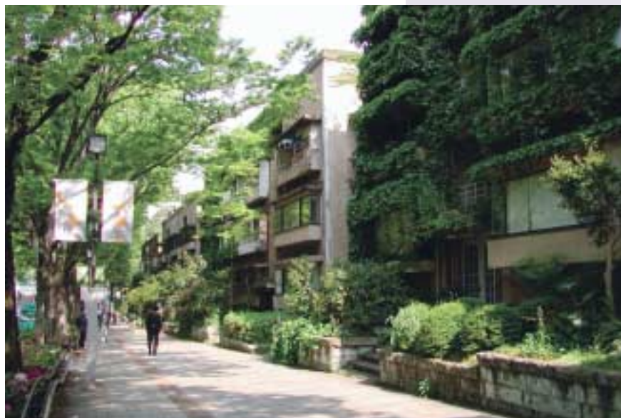
同潤会青山アパート