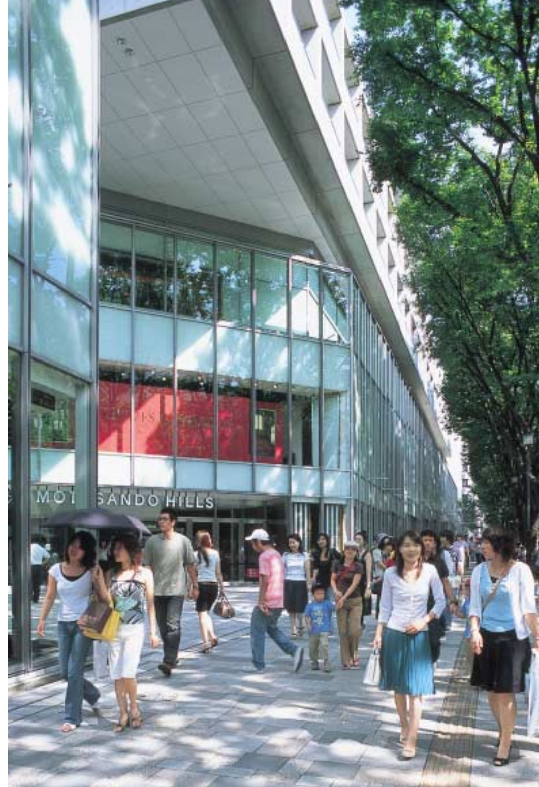
表参道ヒルズ エントランス周辺

明治神宮の造営に伴い、大正10年、参道に4、50cmのケヤキの苗木が201本植えられた。しかし東京大空襲で13本を残して大半を焼失。それを昭和24~26年に何回かに分けて補植したが、今のケヤキ並木である。その後、台風などによる倒壊で、戦前からのケヤキは11本を残すのみ。樹齢86年以上になる。その他は樹齢60年で、現在は163本のケヤキと5本のイチョウが表参道の象徴になっている。このシンボルを守るために、1981年から順次、健康診断を行ってきたが、かなりの老朽化や幹の空洞化が目立ってきたため、今年「櫛会」で樹木医によるケヤキの健康診断と応急手当を全エリアで実施した。費用負担は大きいですが、この診断結果を基に都に土壌改良などの保全策を申請したいと考えている。