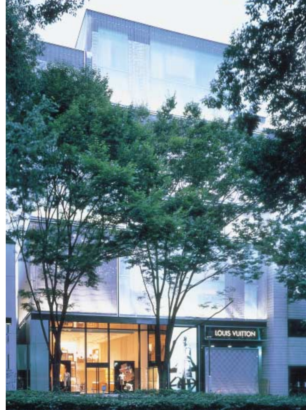
表参道側外観夕景（LVホールとも写真：DAICI ANO）

名称：ルイ・ヴィトン表参道 所在地：東京都渋谷区神宮前5-7-5 設計・監理：青木淳建築計画事務所（本体、外装、一部内装） 施工：清水建設 敷地面積：594.82m 2 建築面積：512.89m 2 延床面積：3,258.73m 2 規模：地下2階、地上8階 構造：S造、一部SRC造 工期：2001.4～2002.8