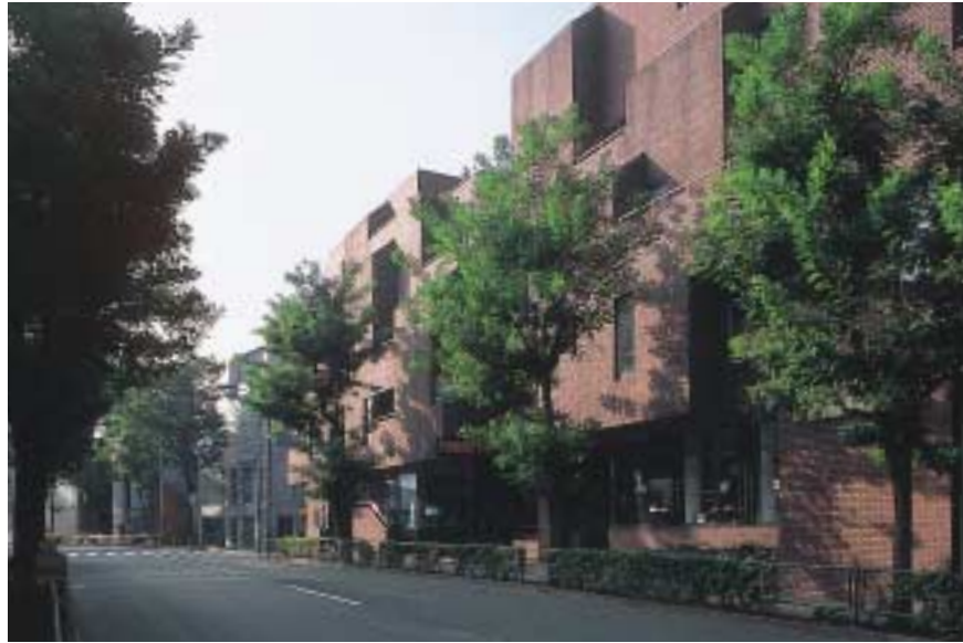
みゆき通り 手前はFROM・ファースト。奥はCOLLEZIONE