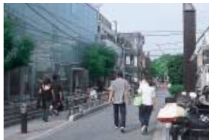
キャットストリート 左はhhstyle.com