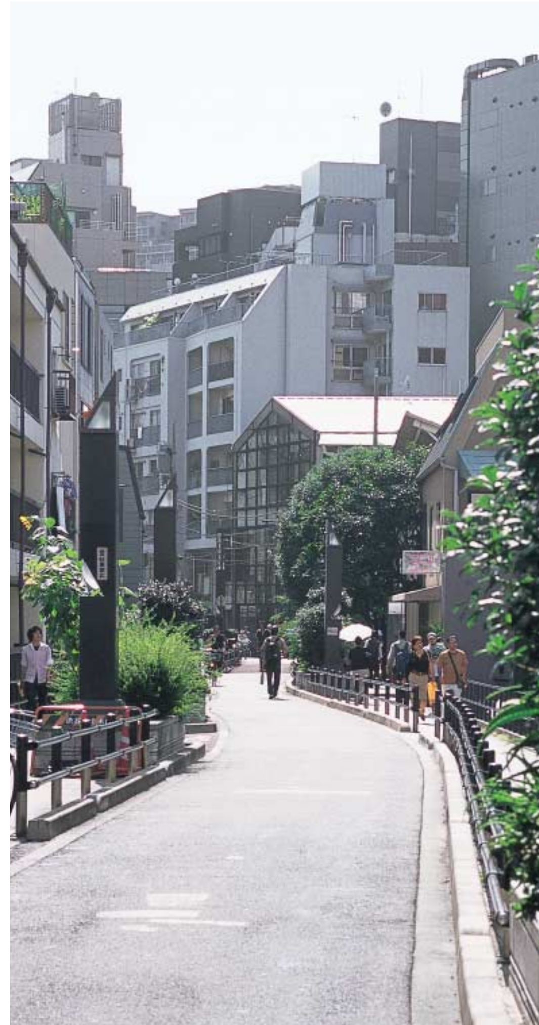
キャットストリート

「フィガロ」に頼んで「FROM・ファースト」の1階角にはカフェをつくってもらった。高級ブランドが、表参道や青山からカフェとレストラン、映画館などを存在不可能に追いやった。私の大切な仕事は、ストリートにカフェと映画館など楽しい街に不可欠な生活を、NPO活動を通じて取り戻すことになるだろう。*