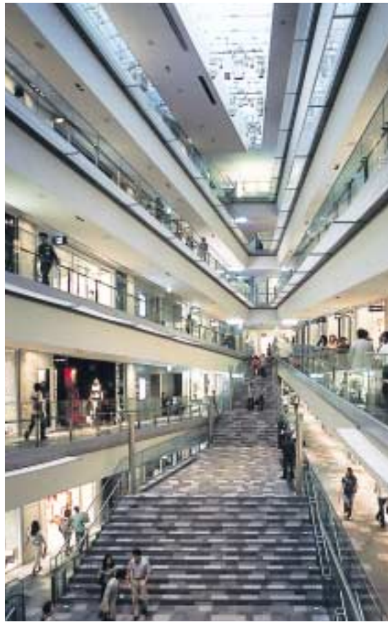
表参道ヒルズ 内観

その比較的均質なファサードに、パブリックアートとしての動く映像の壁画を備え付け、情報、アートの発信の意味も持たせている。しかも内部の吹抜け空間は、その大階段、地下3階の多目的スペースと相まってさまざまな環境演出ができるようになっている。「メディアシップ」と称する情報を発信し続ける役割を果たしたのである。今後この「表参道ヒルズ」が短・中・長期にわたってケヤキ並木と共に表参道の象徴であり続けることを願っている。*