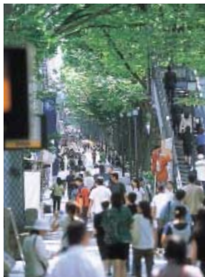
人で賑わう表参道

街が急激に変化してきたのはここ数年で、近年の変化には目をみはるものがある。その中で特徴的なことは、ヨーロッパ、アメリカの大手ブランドを持つ資本グループが当地に土地を取得し自社ビルを建設、店舗のみならずアジアでの拠点を表参道に移すケースが相次いでいる。これは原宿、表参道の