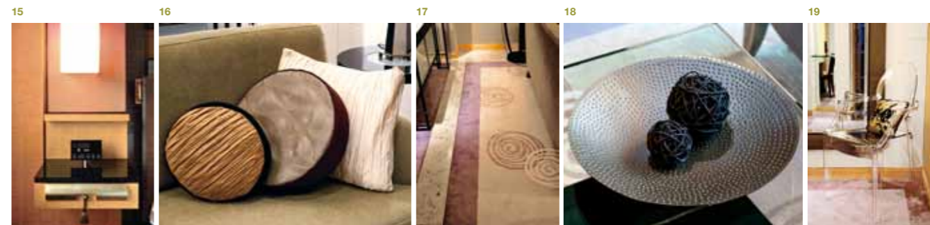
14——ガーデンスイートのリビング：江戸時代から伝わる金、黄、紅色とさまざまな種類の茶色でまとめられた和みの空間。「エグゼクティブハウス 禅」の客室は一つひとつ趣が異なるが、一貫して“侘び・寂び”をテーマにモダンにデザインされている