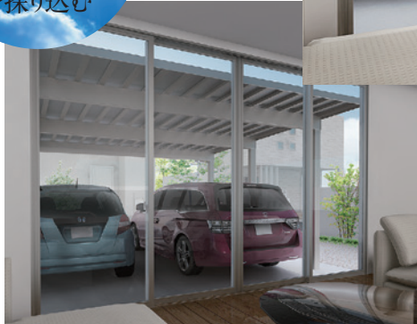
折板屋根のカーポート ※写真はイメージです。