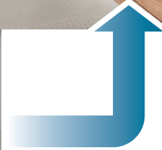
ソルディーポート