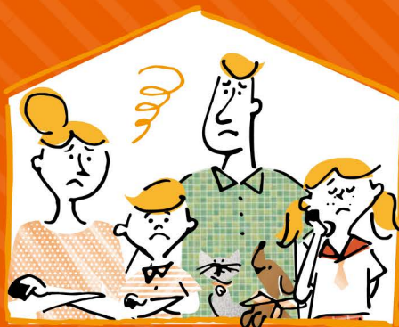
Illustration © LIXIL + SHILUSHI. All Rights Reserved.